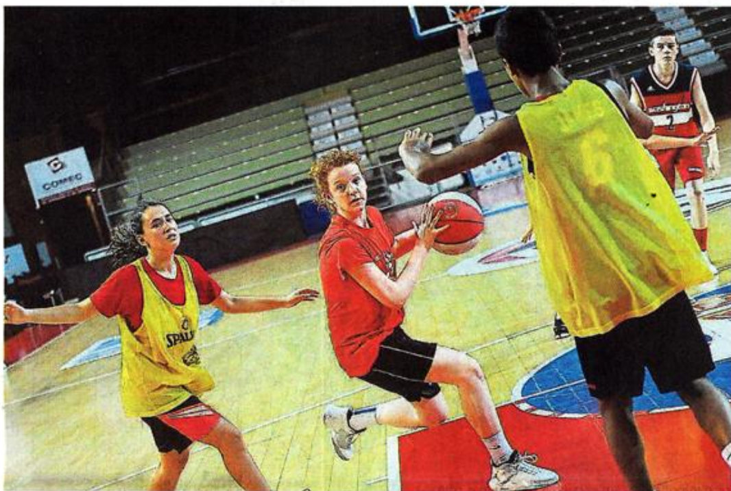
Cholet, la Meilleraie, hier. Près de 590 jeunes ont foulé les parquets choletais.

C'est la règle à Cholet : plus les semaines passent, plus le niveau augmente. Les catégories U9 et U11 (nés de 2006 à 2009) ont ouvert le bal, début juillet, pour un « mini-camp » de trois jours contre cinq pour les autres catégories. Assis à deux pas des tribunes de la Meilleraie, Jean-François Martin, le directeur des camps d'été de CB explique : « L'idée est de leur donner le goût de l'effort. C'est la découverte d'un travail concentré : le matin, entraînement, et l'après-midi, matches. Et cela sur trois jours. Ils découvrent aussi la notion de fatigue, l'enthousiasme d'être dans un groupe... À un âge où ils peuvent