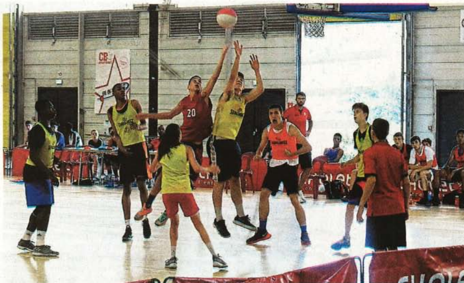
Les U17, appelés NBA dispose de leur propre halle pour s'entraîner.

Lui et les autres entraîneurs de Cholet Basket auront accompagné près