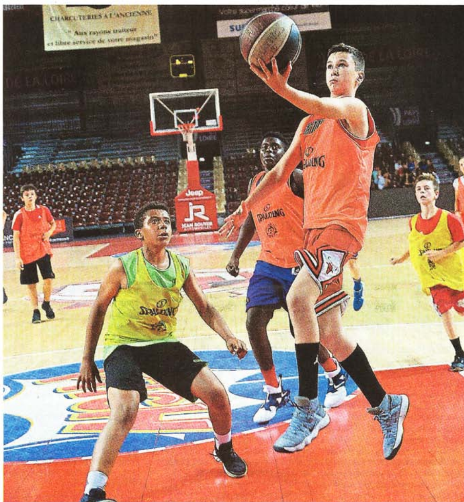
Cholet, salle de la Meilleraie, hier après-midi. Durant la journée, les ateliers alternent avec des matchs, sous les yeux des entraîneurs.

L'image et l'histoire du club attirent ainsi des basketteurs venant de toute la France, parfois même de l'étranger. « Deux des jeunes viennent d'Espagne. D'autres de Guadeloupe, de Martinique, de Guyane. » Il faut dire que le « all of fame » des anciens des camps d'été de CB a de quoi faire