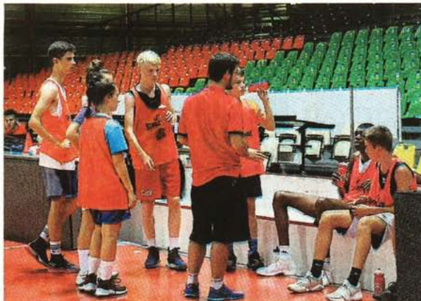
En tout 18 coaches et trois assistants encadrent les jeunes du camp Élite. Certains viennent de Vendée, d'autres encore d'Espagne.