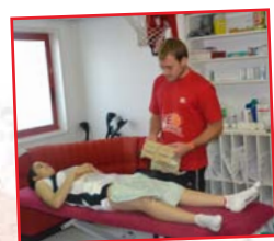
Deux kinés sont également présents lors des camps